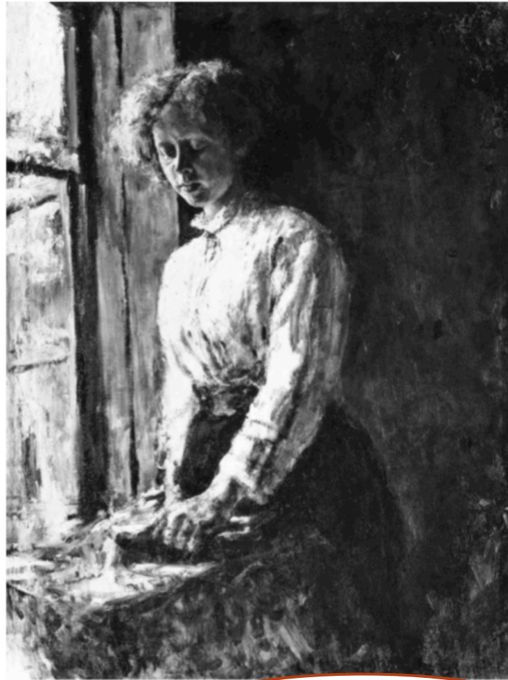
By the Window. Portrait of Olga Trubnikova (1886)

(¿cómo representa a la mujer? ¿en qué sentido es realista?)